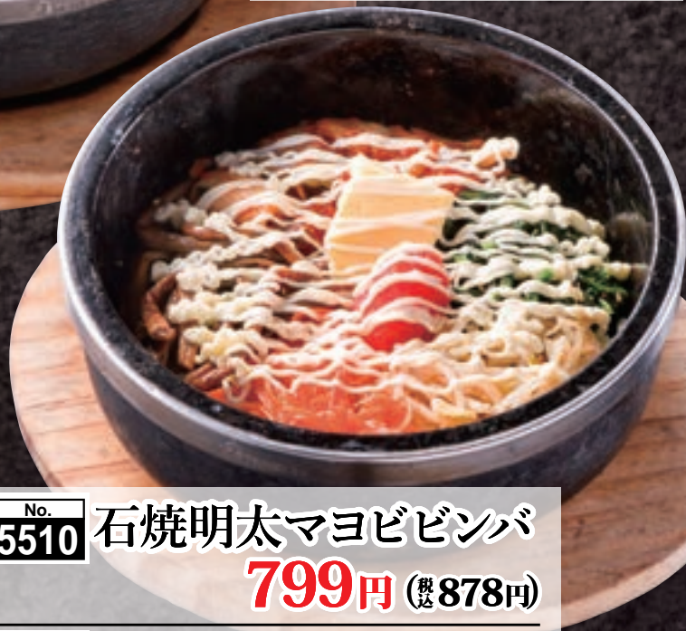
No. 5510 石焼明太マヨビビンバ 799円 (税込878円)