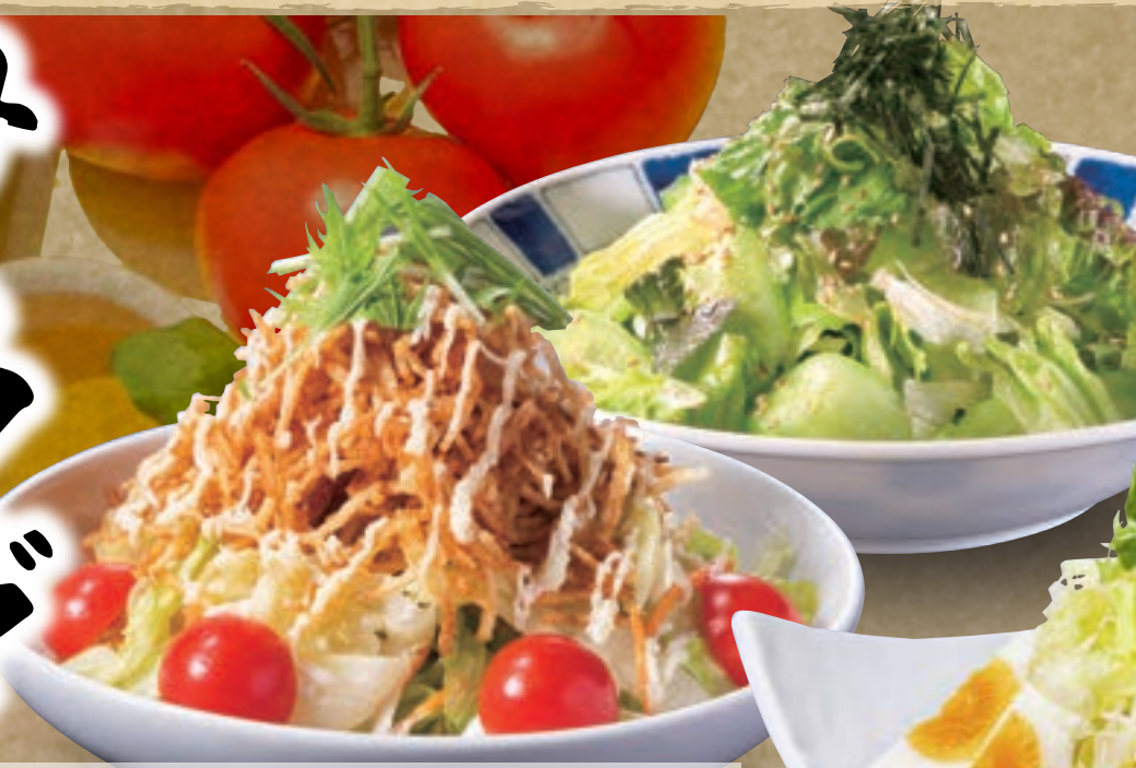
No. 5350 パリパリサラダ 699円 (税込768円)