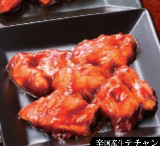
辛国産牛テチャン