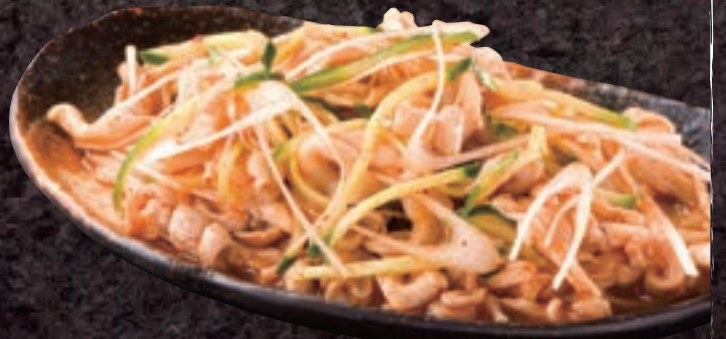
No. 5403 ピリ辛ポークガツ刺し 599円 (税込658円)