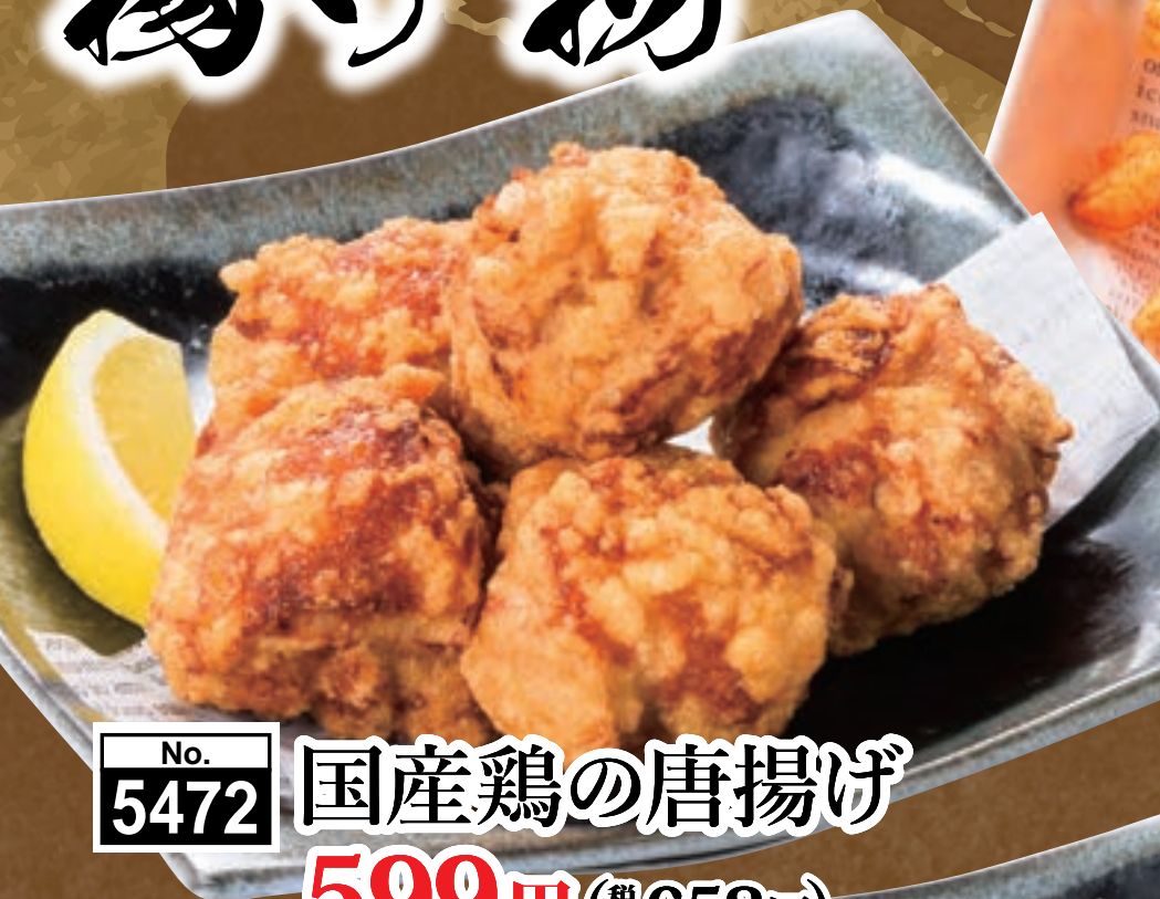
No. 5472 国産鶏の唐揚げ 599円 (税込658円)