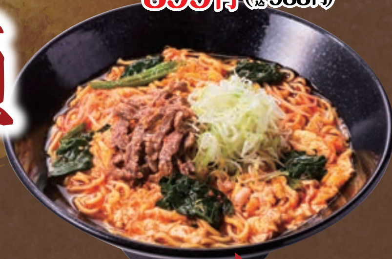
No. 5640 ュッケジャンラーメン 899円 (税込988円) No. 5645 辛 ュッケジャンラーメン 999円 (税込1,098円)