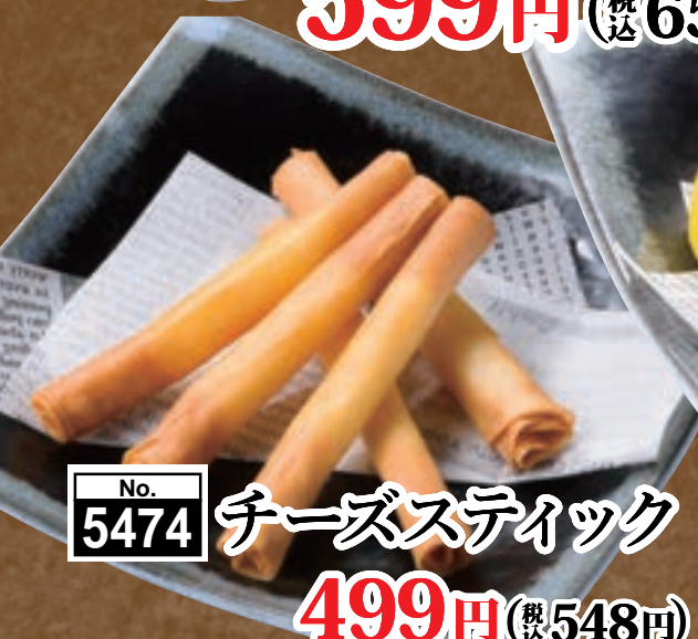
No. 5474 チーズスティック 499円 (税込548円)