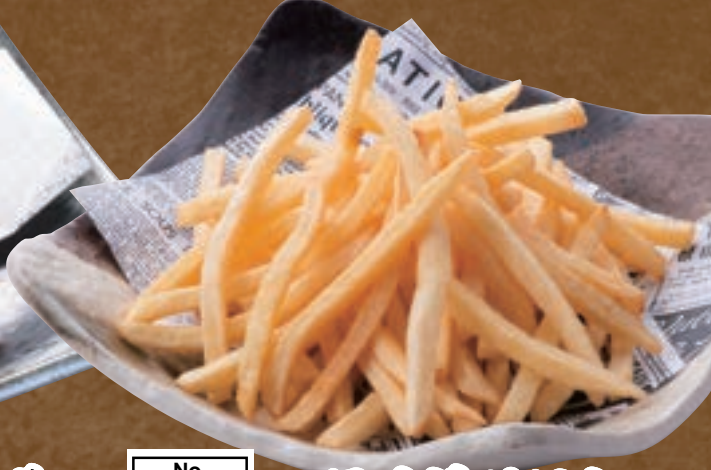
No. 5470 フライドポテト 399円 (税込438円)