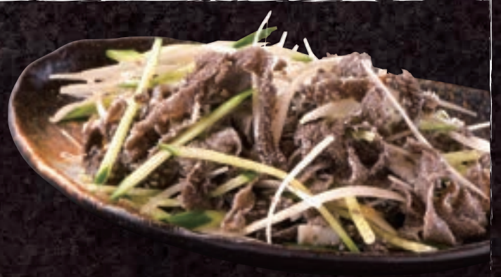
No. 5404 牛せんまい刺し 699円 (税込768円)