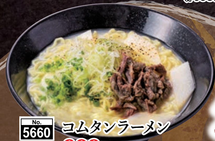
No. 5660 ヨムタンラーメン 999円 (税込1,098円)