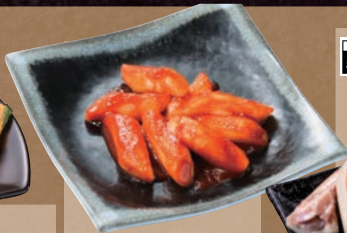
No. 5462 トッポギ 399円 (税込438円)