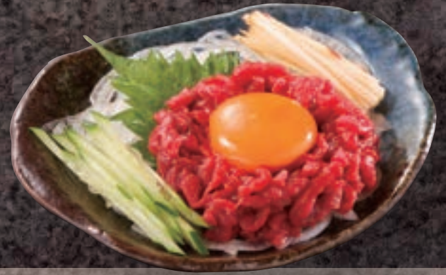
No. 5402 桜ユッケ(馬肉) 999円 (税込1,098円)