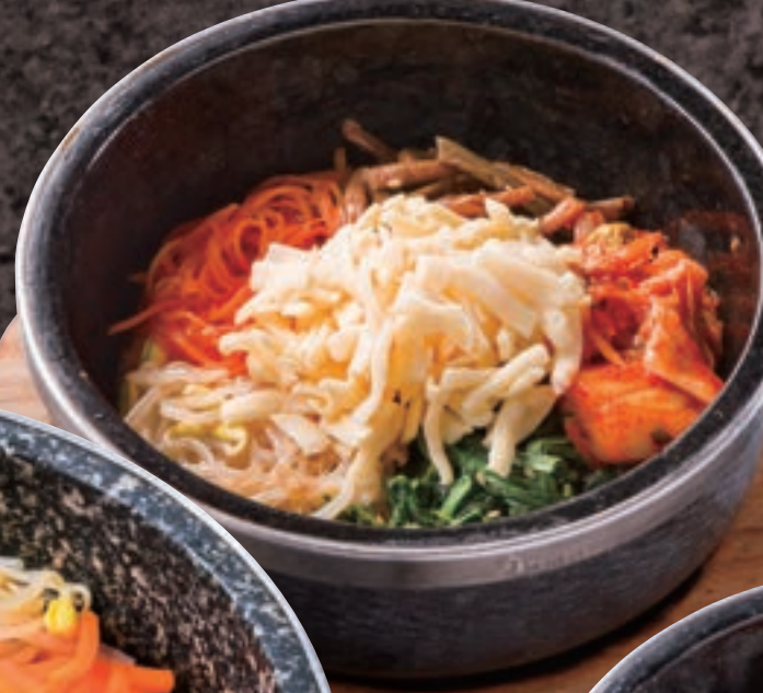
No. 5520 石焼 チーズビビンバ 799円 (税込878円)