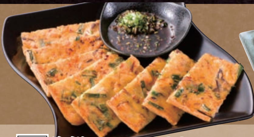
No. 5460 海鮮チヂミ 999円 (税込1,098円)