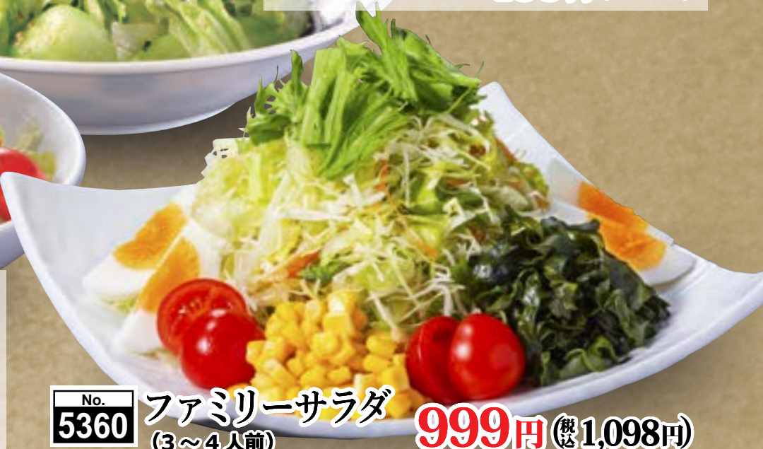
No. 5360 ファミリーサラダ (3~4人前) 999円 (税込1,098円)