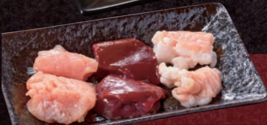
牛ホルモンミックス3種