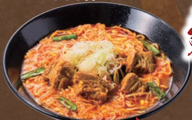
No. 5650 カルビラーメン 899円 (税込988円) No. 5655 辛 カルビラーメン 999円 (税込1,098円)