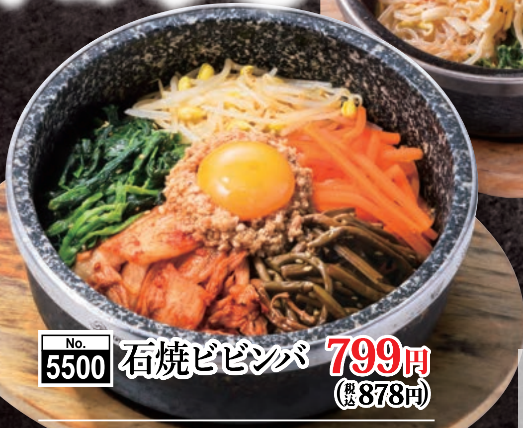
No. 5500 石焼ビビンバ 799円 (税込878円)