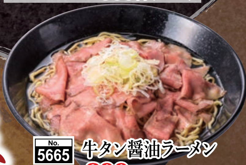
No. 5665 牛タン醤油ラーメン 899円 (税込988円)