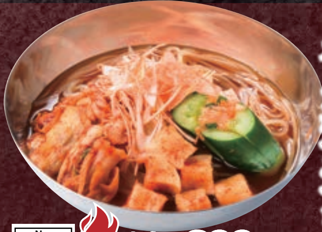
No. 5671 ミニ冷麺 499円 (税込548円)