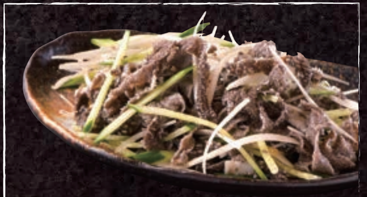
No. 5404 牛せんまい刺し 699円 (税込768円)