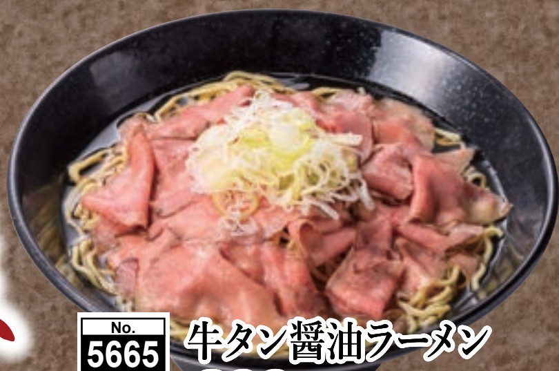
No. 5665 牛タン醤油ラーメン 899円 (税込988円)