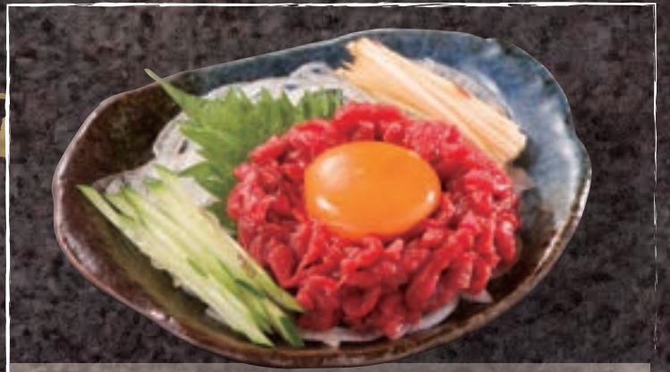
No. 5402 桜ユッケ(馬肉) 999円 (税込1,098円)