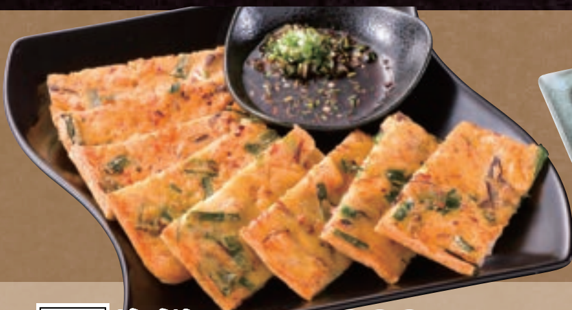
No. 5460 海鮮チヂミ 999円 (税込1,098円)