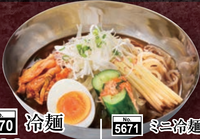
No. 5670 冷麺 799円 (税込878円)