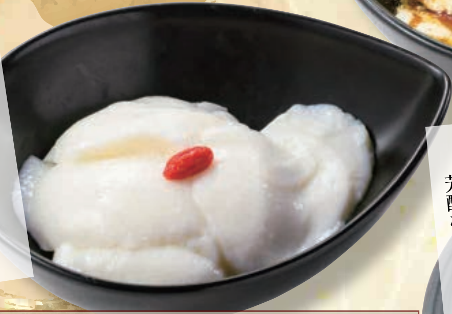
No. 5775 濃厚杏仁豆腐 299円(税込328円)