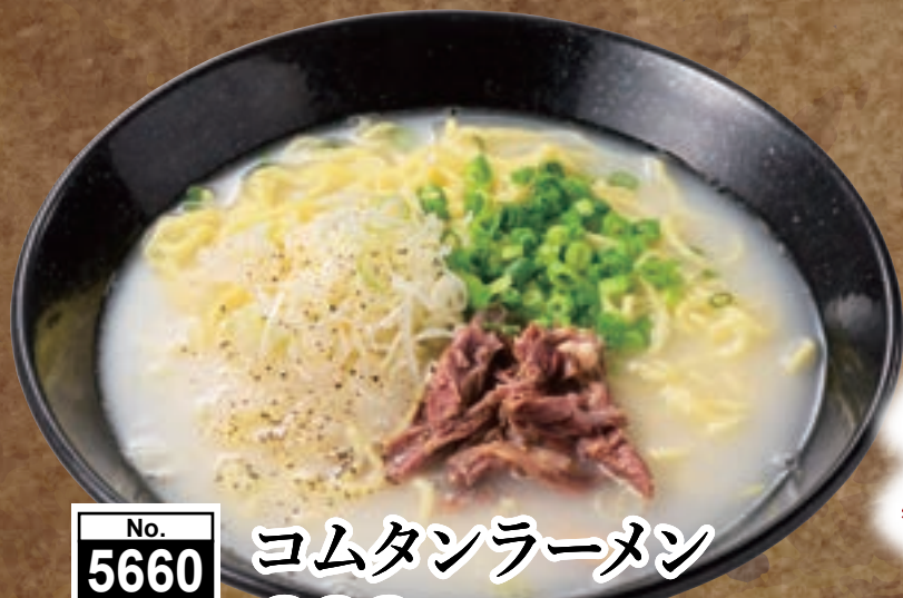
No. 5660 コムタンラーメン 999円 (税込1,098円)