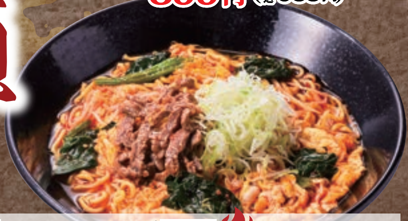
No. 5640 ュッケジャンラーメン 899円 (税込988円)