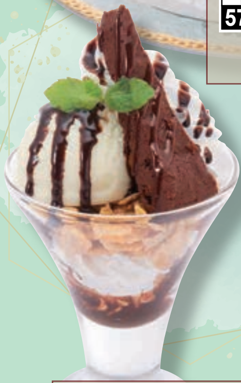
No. 5790 ミニショコラパフェ 499円(税込548円)