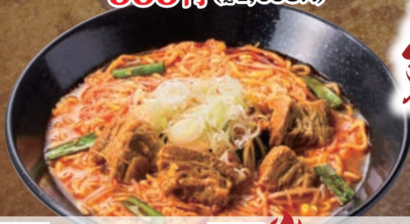
No. 5650 カルビラーメン 899円 (税込988円)