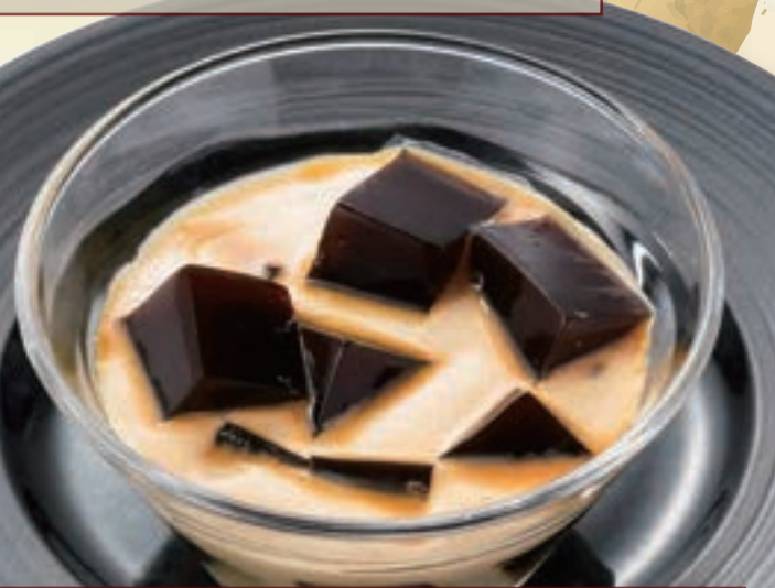
No. 5765 自家製コーヒーゼリー 299円(税込328円)