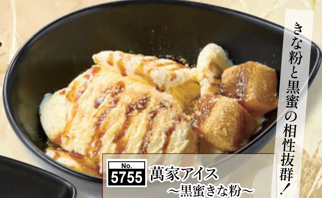
No. 5755 萬家アイス ～黒蜜きな粉～ 299円(税込328円)