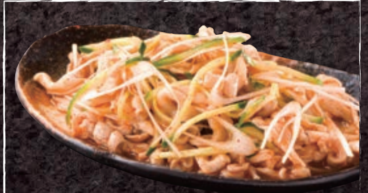
No. 5403 ピリ辛ポークガツ刺し 599円 (税込658円)