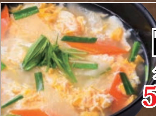
No. 5600 クッパ 599円 (税込658円)