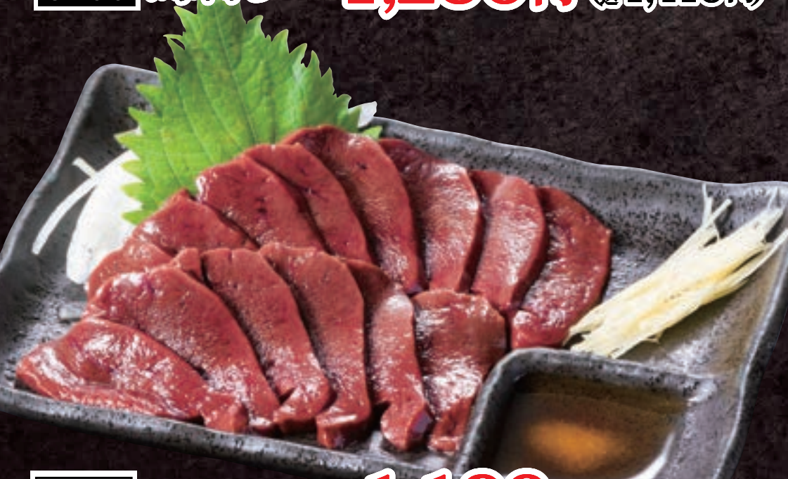
No. 5401 馬レバ刺し 1,190円 (税込1,309円)