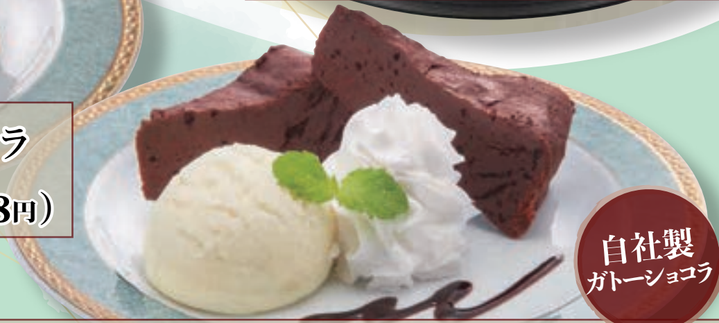
No. 5780 ガトーショコラ 399円(税込438円)