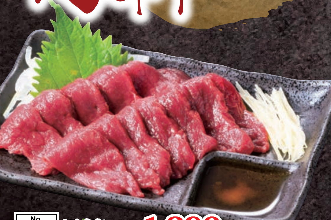
No. 5400 馬刺し 1,290円 (税込1,419円)